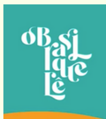
Webinário Balanços e perspectivas da pesquisa O Brasil que Lê Itaú Cultural Clique aqui