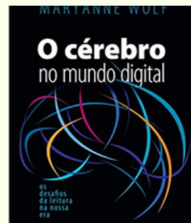
O Cérebro no mundo digital Maryanne Wolf Editora: Contexto