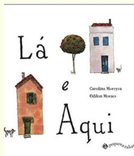
Lá e Aqui Carolina Moreyra e Odilon Moraes Editora: Pequena Zahar