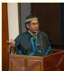
Ailton Krenak recebe título Honoris Causa UNB