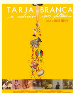
Tarja Branca Documentário Clique aqui