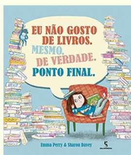
Eu não gosto de livro Emma Perry Editora: Salamandra