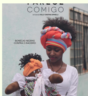
Parece Comigo Documentário Clique aqui