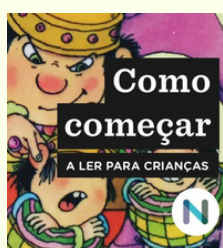
Como começar a ler para criança Ruth Rocha Clique aqui