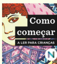
Como começar a ler para criança Tatiana Belinky Clique aqui