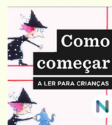
Como começar a ler para criança Eva Furnari Clique aqui